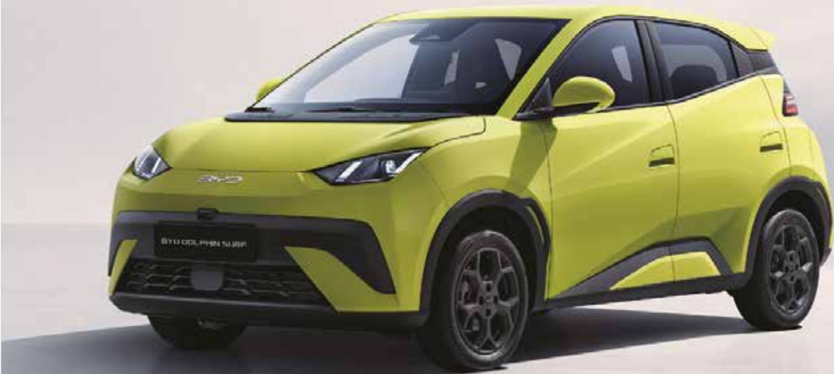
Markantes Scheinwerferdesign mit serienmäßigem Tagfahrlicht