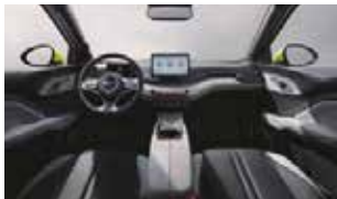
Black and grey