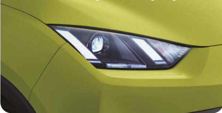
Markantes Scheinwerferdesign mit serienmäßigem Tagfahrlicht